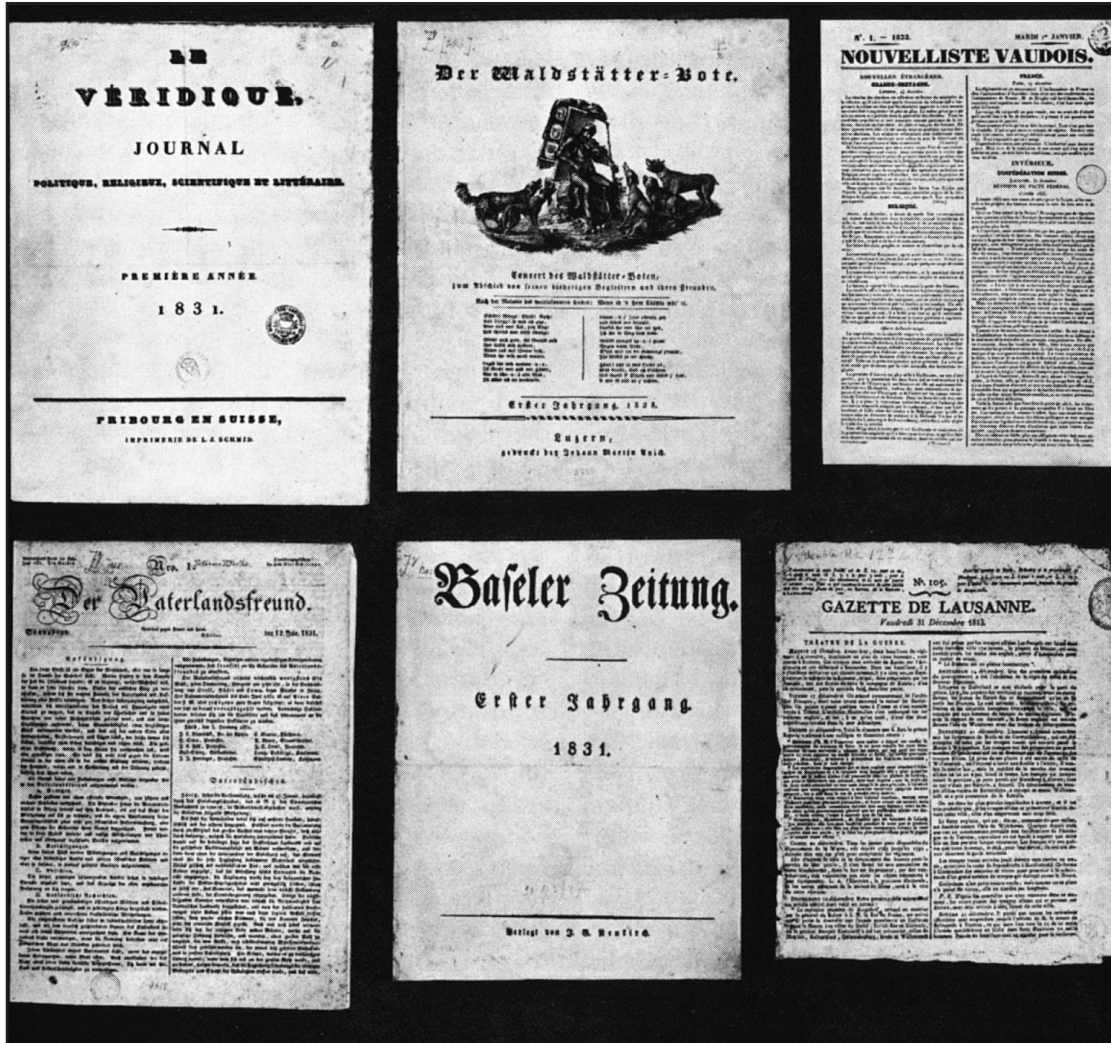
aus: Illustrierte Geschichte der Schweiz, Band 3, E. Spiess, Benzinger Verlag